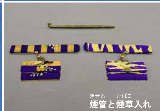
きせる たばこ 煙管と煙草入れ