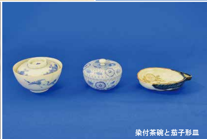
染付茶碗と茄子形皿