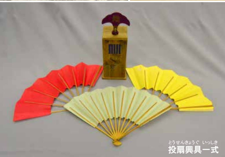
どうせんきょうぐ いっしき 投扇興具一式