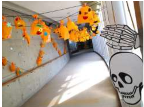
カウンタープチ工作「ビニールかぼちゃ」 展示風景