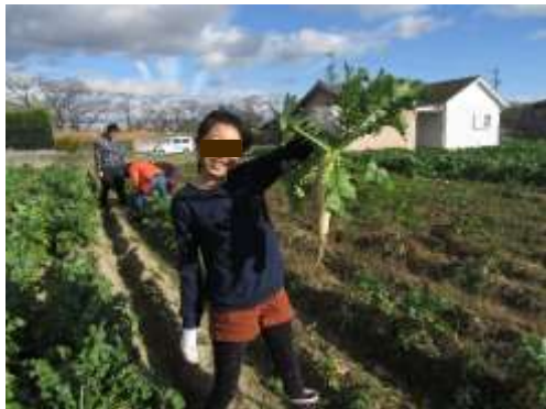
宮重大根を育ててみよう！プロジェクト 収穫の様子