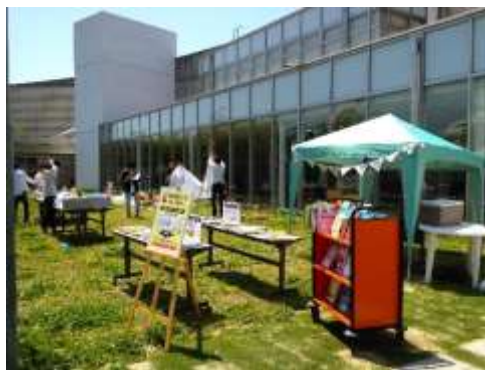
夢の森パークライブラリーの様子