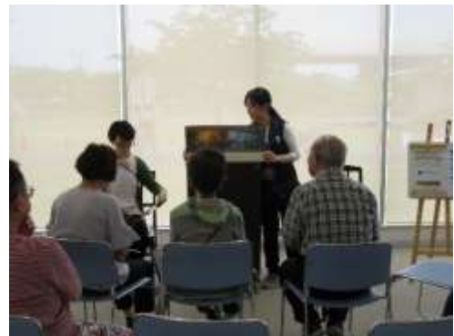
大人のためのおはなし会の様子