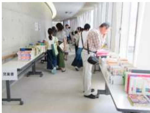
リサイクル会の様子