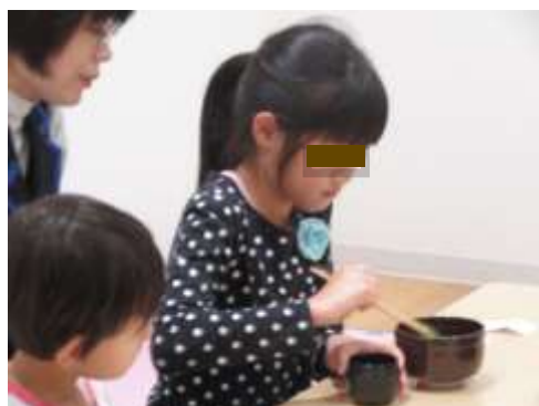
初めてのお抹茶体験の様子