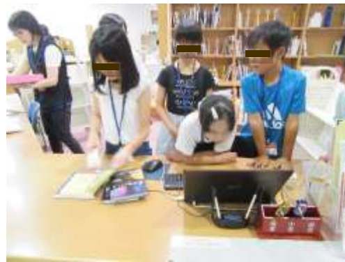
夏休み子ども図書館員体験の様子