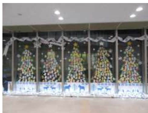
カウンター工作「オーナメントでツリーを飾ろう！」展示風景