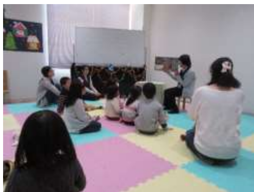
クリスマスおたのしみ会の様子