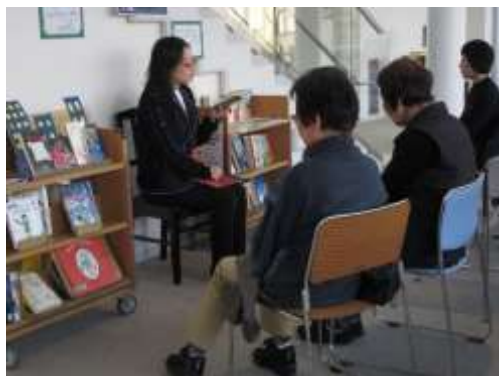
大人のためのおはなし会の様子