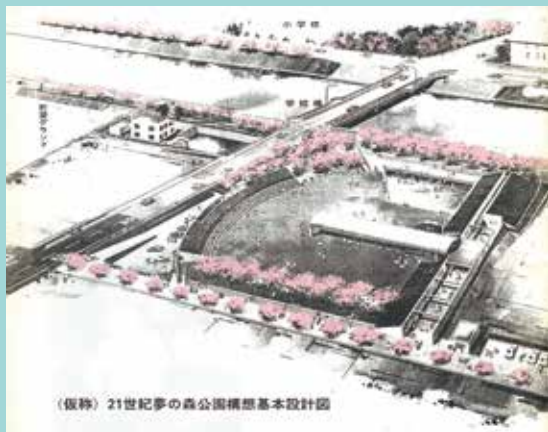
(仮称) 21世紀夢の森公園構想基本設計図