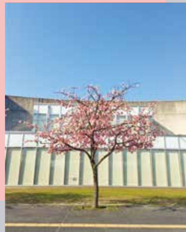
▶交流テラス前の河津桜