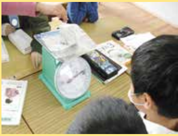
△ 物の重さをくらべる