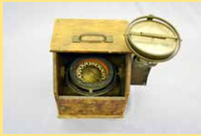
△ 羅針盤(左)・方位盤(右)