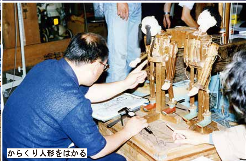
からくり人形をはかる