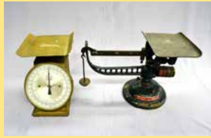
△ 上皿ばね秤(左)・台秤(右)