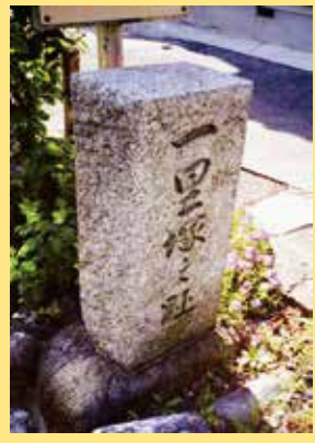
△ 須ヶ口一里塚之趾碑