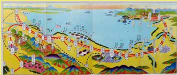
△ 伊勢参宮近道（案内チラシ）